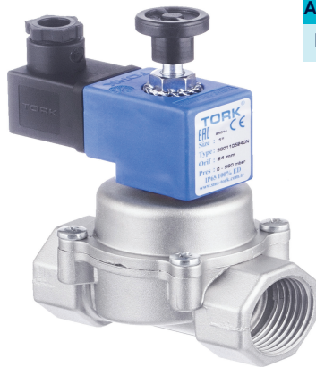
ATIDARYTO VEIKIMO (NO) DARBAS SU BITAS US-06

Avariniai lygiai : 1 (15-23)AUR ; 2 (35-43)AUR Reakcijos laikas: 10 sek. Garso signalas : 1lygis/85db Rėlinis išėjimas: : 2 lygis arba avarinis gedimas Darbinė temperatūra: -20C, +45C